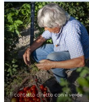
Il contatto diretto con il verde