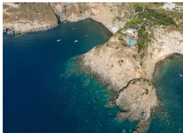
Punta Chiarito è una struttura ideale per chi ama

HEBERGEMENT EN CHAMBRE DOUBLE PENSION COMPLETE POUR 7 JOURS/6 NUITS 618 euros à régler directement à l'hôtel